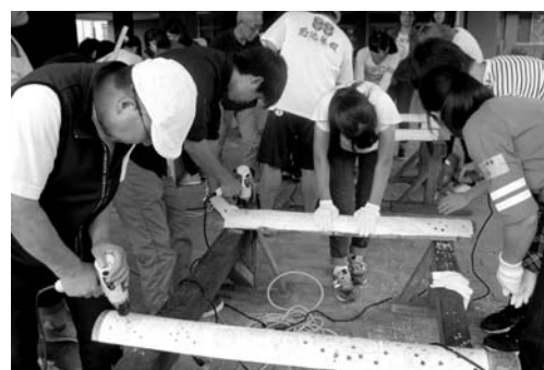
「もやいすと(地域)ジュニア育成」のフィールドワーク風景 (菊池高校での域学ワークショップ「竹とろうろ製作」)