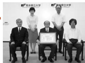
名誉教授称号授与式