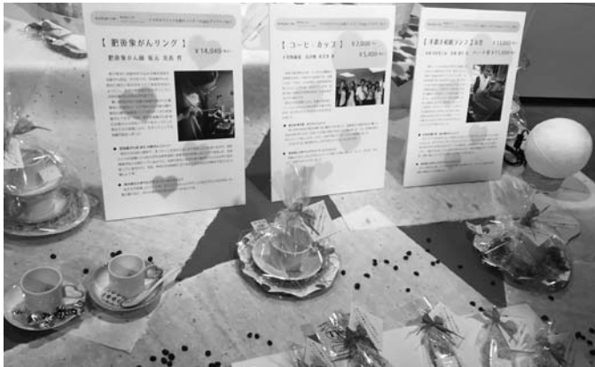
(工芸館内でのコラボレーション商品の展示風景)

熊本県は多くの伝統工芸を有していますが、熊本県伝統工芸館(以下「工芸館」)の施設も含め、工芸品の魅力が十分に伝達できていない現状にあります。そこで私達は、工芸ファンの高齢化に伴う来館者の減少に歯止めをかけ、新たなターゲット層として若い世代に関心を持ってもらう必要があると考え、本研究に取り組みました。昨年度は、工芸館活性化のための施策検討のため、アンケートによる工芸館のイメージ調査や、人を引きつける施設の要素抽出のためのフィールドワーク、さらには工芸家へのインタビューを実施。これらの研究結果から、若年層の指示を得るためには、知識を得る場から感動する場へ、作品を見る場から体験する場へ、そして、技術がすごい作品から使ってみたい好きな商品へシフトチェンジが必要があると考えました。そこで、私たちは、工芸館活性化のために、①館内の順路化と伝統と現代を融合させた本格カフェを設置する「エンターテイメント化」