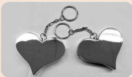
色はシルバーとピンクがあります。