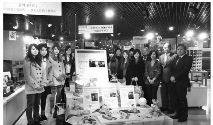
(工芸館内コラボレーション商品の展示を囲んでの1枚)

②工芸家と消費者を結ぶ架け橋としての役割を工芸館が果たすようにする「ステーション化」③『HAPPYくらふと』と題した伝統と現代を融合させる新ジャンルを創り、より消費者ニーズに近い工芸品の提供を目指す「コラボレーション化」、これら3つの施策を提案。昨年の12月に実施された学生GP(地域連携型卒業研究)*公開審査会において、最優秀賞を受賞しました。また、「コラボレーション化」に関しては、私たち学生がハートをテーマに作成したデザインをプロの工芸家の方々に商品化して頂き、バレンタインシーズンに工芸館で展示、販売して頂くことが出来ました。今年度は、私たちの後輩が「ステーション化」の実現、すなわち、工芸館で実際に本格カフェを実験的にオープンさせようと企画し、実現のために奔走しています。来年の2月頃にオープン予定と聞いておりますので、皆様楽しみにしておいて下さい。