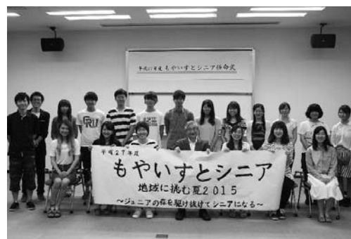
平成27年7月13日 もやいすとシニア任命式

ジュニア/シニア育成の科目全てにフィールドワークや演習、グループ活動を組み込み、そして授業の最後には成果発表会を開催する等、学生たちの学びを深める工夫した育成プログラムとしています。