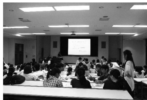
「もやいすと(地域)ジュニア育成」の授業風景