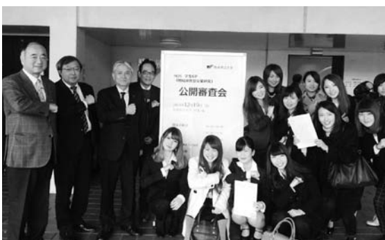
(公開審査会後の1枚)

熊本県は多くの伝統工芸を有していますが、熊本県伝統工芸館(以下「工芸館」)の施設も含め、工芸品の魅力が十分に伝達できていない現状にあります。そこで私達は、工芸ファンの高齢化に伴う来館者の減少に歯止めをかけ、新たなターゲット層として若い世代に関心を持ってもらう必要があると考え、本研究に取り組みました。昨年度は、工芸館活性化のための施策検討のため、アンケートによる工芸館のイメージ調査や、人を引きつける施設の要素抽出のためのフィールドワーク、さらには工芸家へのインタビューを実施。これらの研究結果から、若年層の指示を得るためには、知識を得る場から感動する場へ、作品を見る場から体験する場へ、そして、技術がすごい作品から使ってみたい好きな商品へシフトチェンジが必要があると考えました。そこで、私たちは、工芸館活性化のために、①館内の順路化と伝統と現代を融合させた本格カフェを設置する「エンターテイメント化」