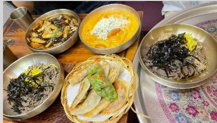
私は一番右のエゴマ油のまぜそばを食べました。