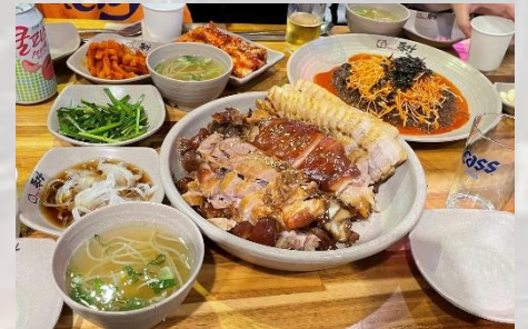
チョッパルとボッサム

送別会では感想を言うときに自分の感情を抑えきれずに涙が出てしまう場面もあり、この1週間がどれほど大切な思い出で、自分にとって最大の財産になりうるかを感じました。