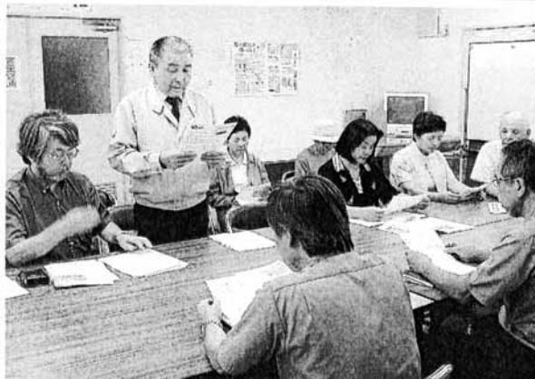
鉄道建設・運輸施設整備支援機構への申し入れ書を 読み上げる住民代表（左から2人目）＝水俣市

九州新幹線（新八代― 鹿児島中央間）の騒音調 査で、熊本県内の沿線住 宅地約二百五十地点の三 割以上が環境省の騒音基 準を超えた問題で、同新 幹線による騒音・振動被 し入れた。