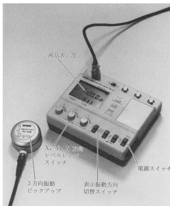
図 振動レベル計と振動ピックアップ（出典：参考文献 [ 2 ], p.152）

機械などからの振動が建物の躯体に伝わり、部屋の壁や床を振動させて音を放射し、騒音となる場合を、_____と言う。_____は空気音とは異なった遮断方法を必要とすることが多い。