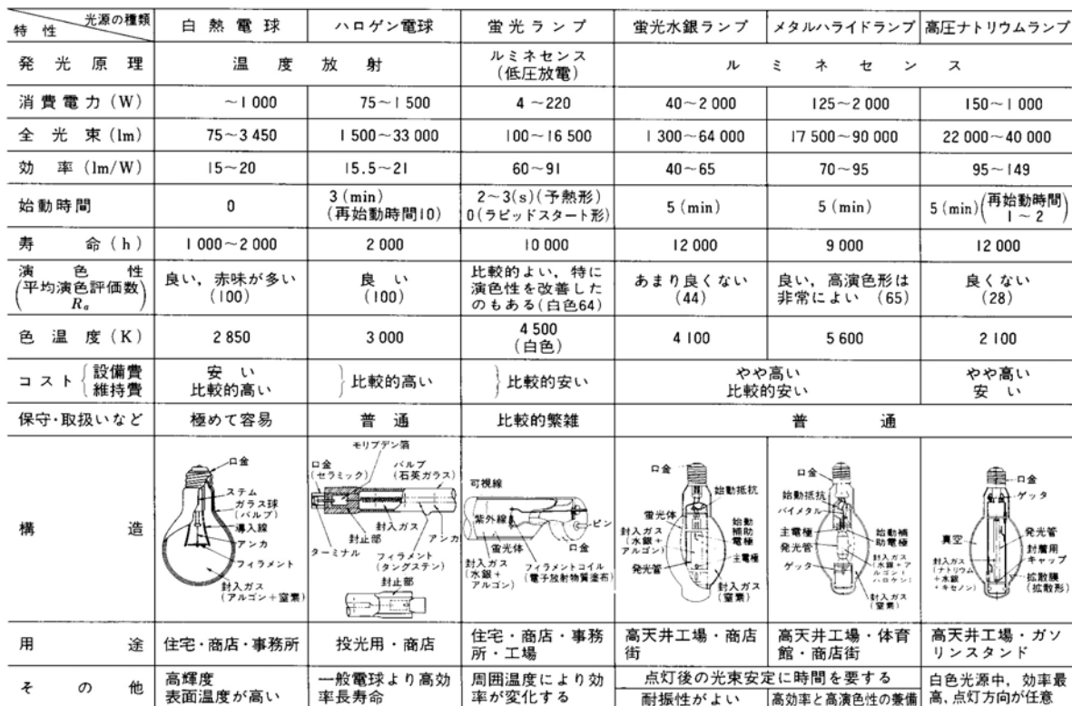
表 主な光源の性能と特徴（出典：参考文献 [1], p.37）