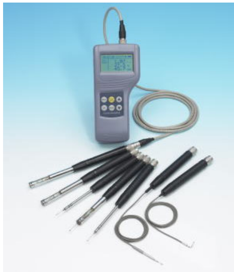
写真 三杯式風速計 (出典: 日本カノマックスの HP)