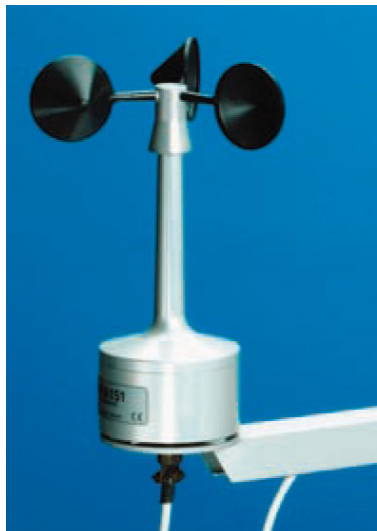
写真 三杯式風速計