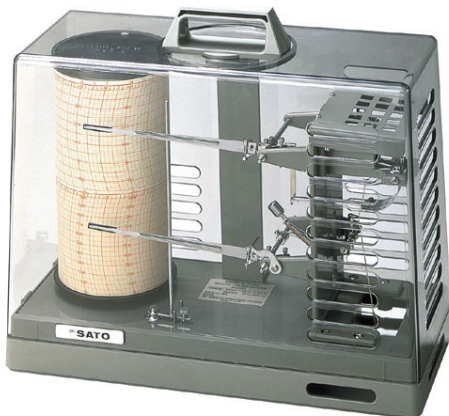
写真 自記式温度計