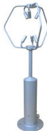
写真 三杯式風速計