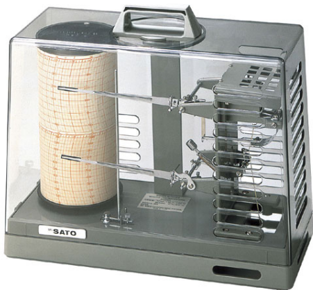
写真 自記式温度計