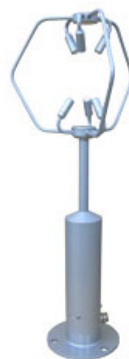
写真 超音波風速計