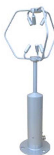
写真 超音波風速計*2