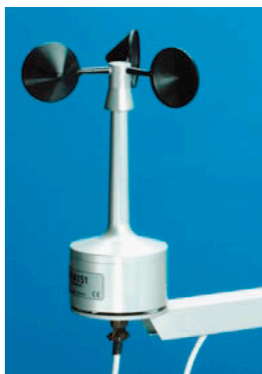
写真 三杯式風速計