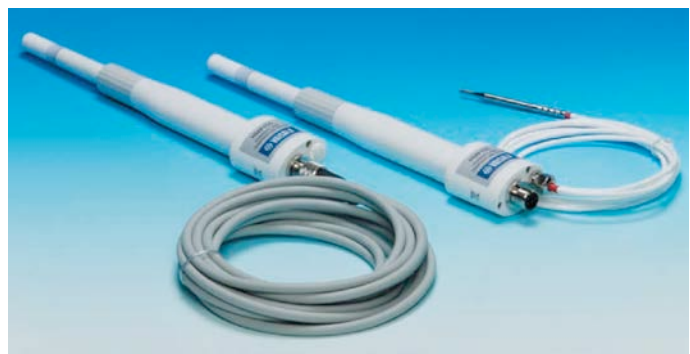
写真 湿度温度プローブ*1