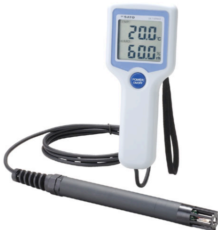
写真 デジタル温湿度計*2