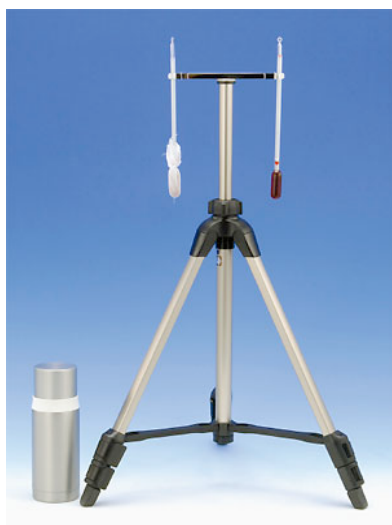
写真 カタ寒暖計 (カタ温度計)