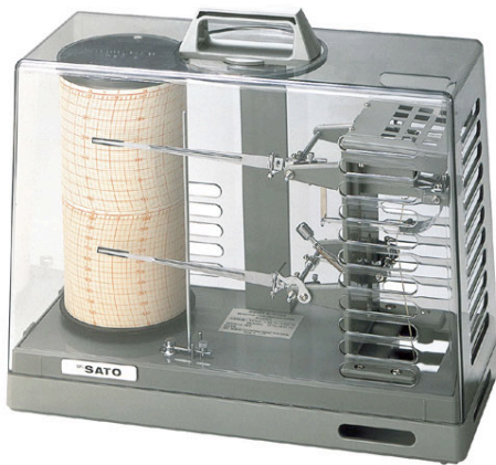
写真 自記式温度計