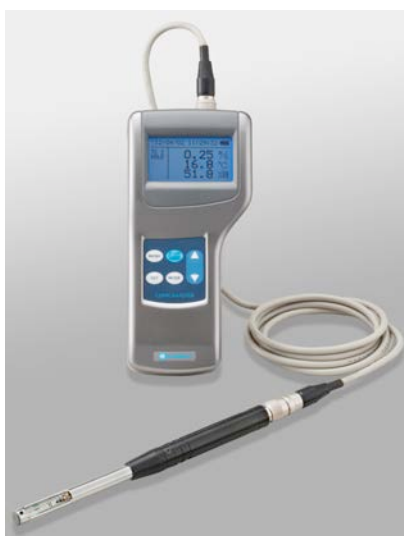
写真 熱線式風速計*1