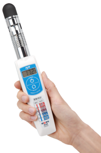
写真 WBGT 計