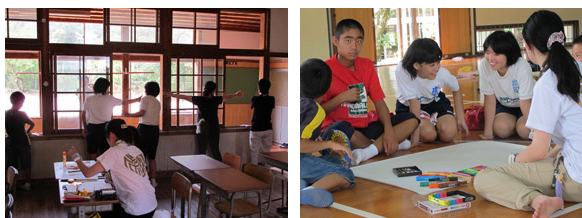
写真2 ワークショップの様子