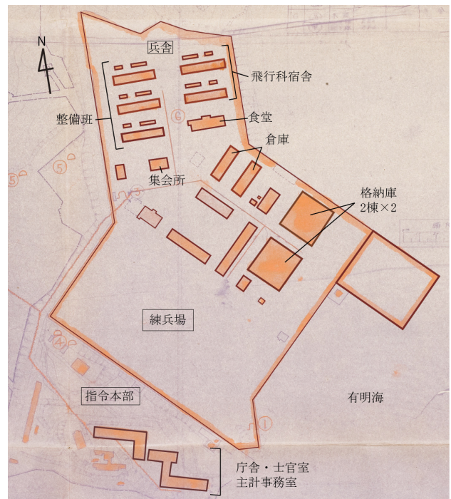
図1 天草海軍航空隊の施設配置

平成23(2011)年7月4日、10月6日、11月2日、11月15日に旧本町中学校校舎の実測を行った。実測図と文献5)、6)、7)などを元に、昭和24(1949)年5